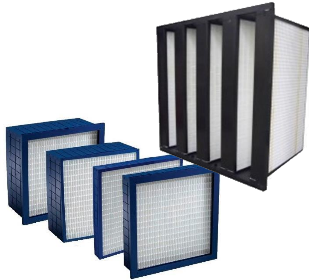
FILTROS CAJA Y RIGIDOS