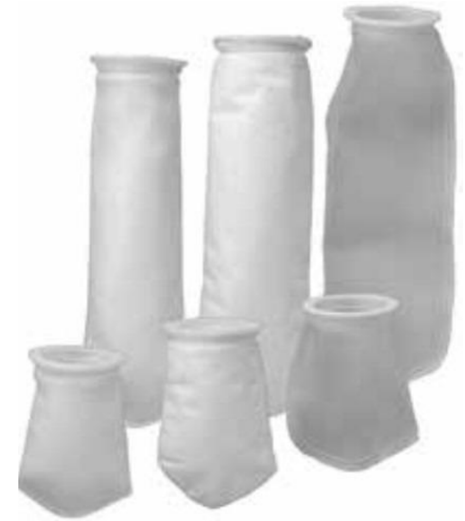
FILTROS BOLSA PARA TRATAMIENTOS CON LIQUIDOS O POLVOS