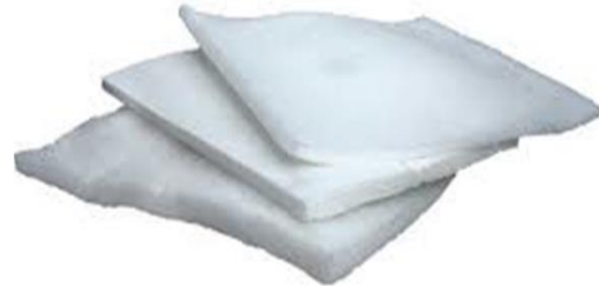
FILTROS ROLLO Y MATERIAL DE ROLLO