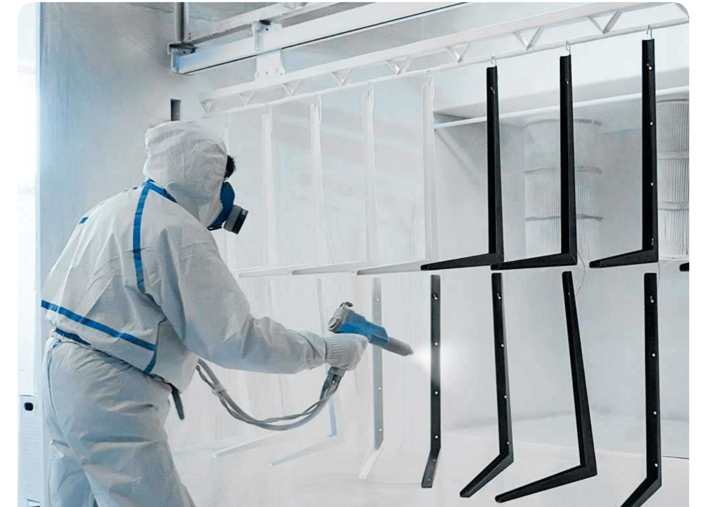
MANTENIMIENTO Y LIMPIEZA