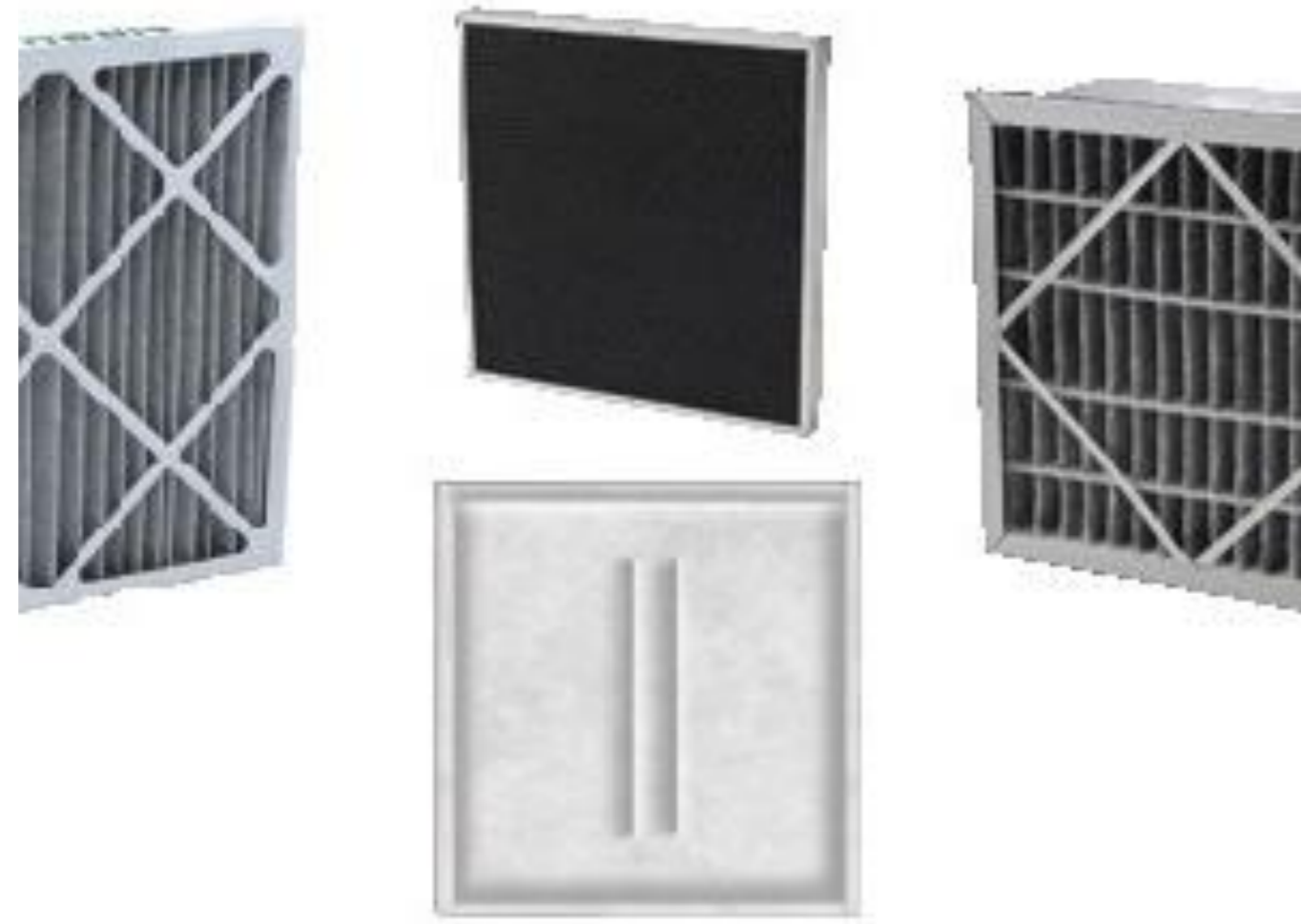
FILTROS CARBÓN ACTIVADO