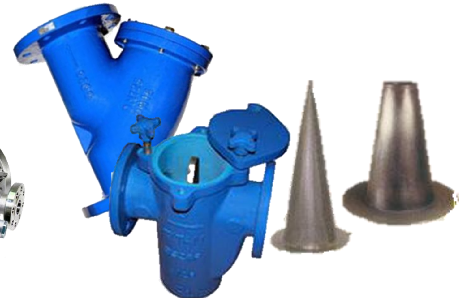
FILTRO CANASTA TIPO 'Y' TIPO 'T'