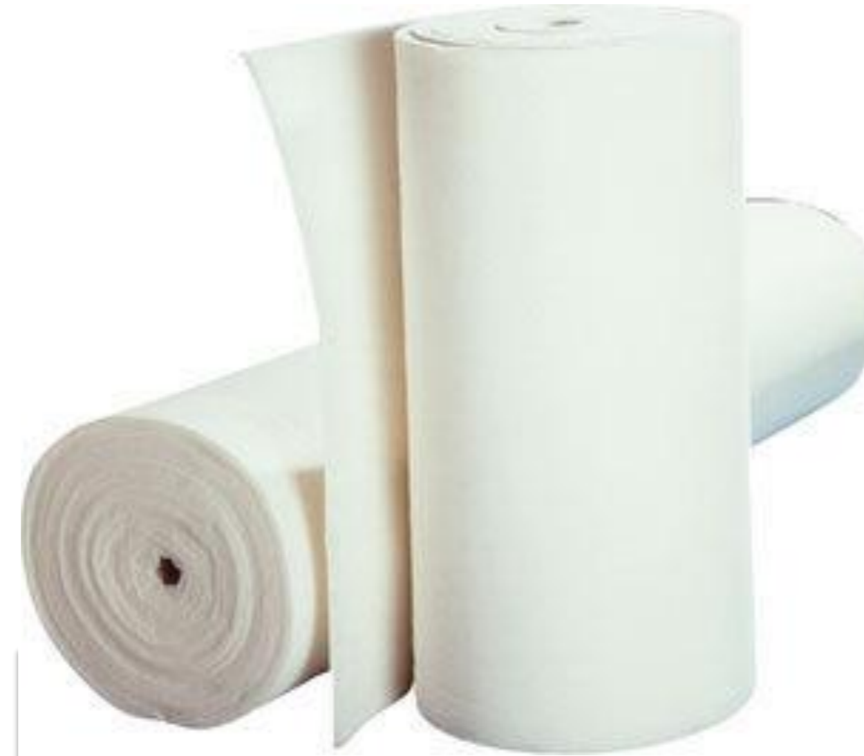
FILTROS DE POLIÉSTER APLICACIÓN EN AIRE