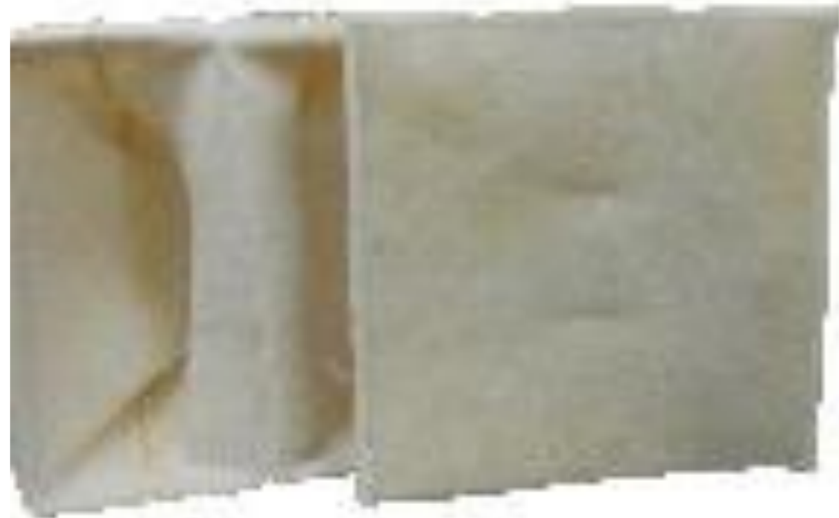
FILTROS PARA CABINA DE PINTURA