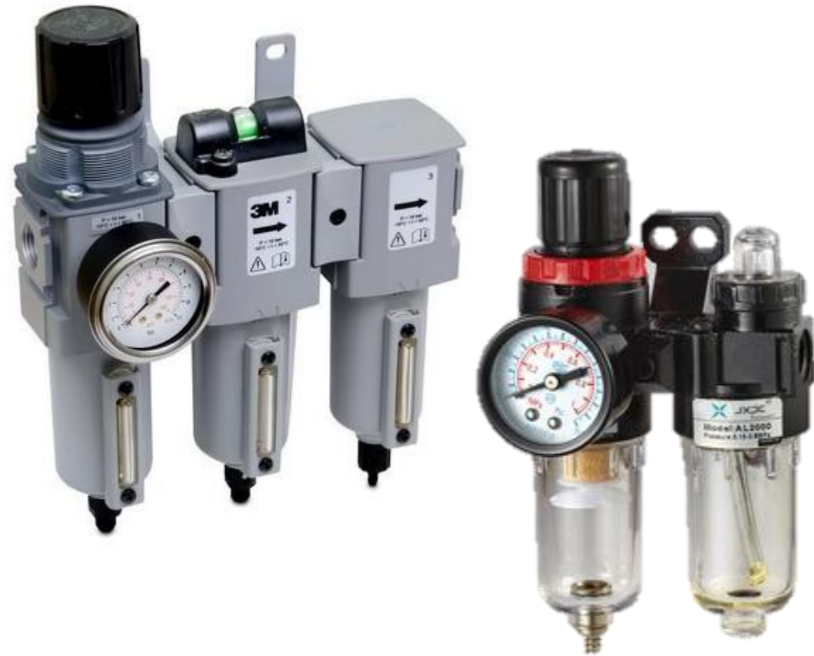
FILTROS REGULADORES Y LUBRICANTES