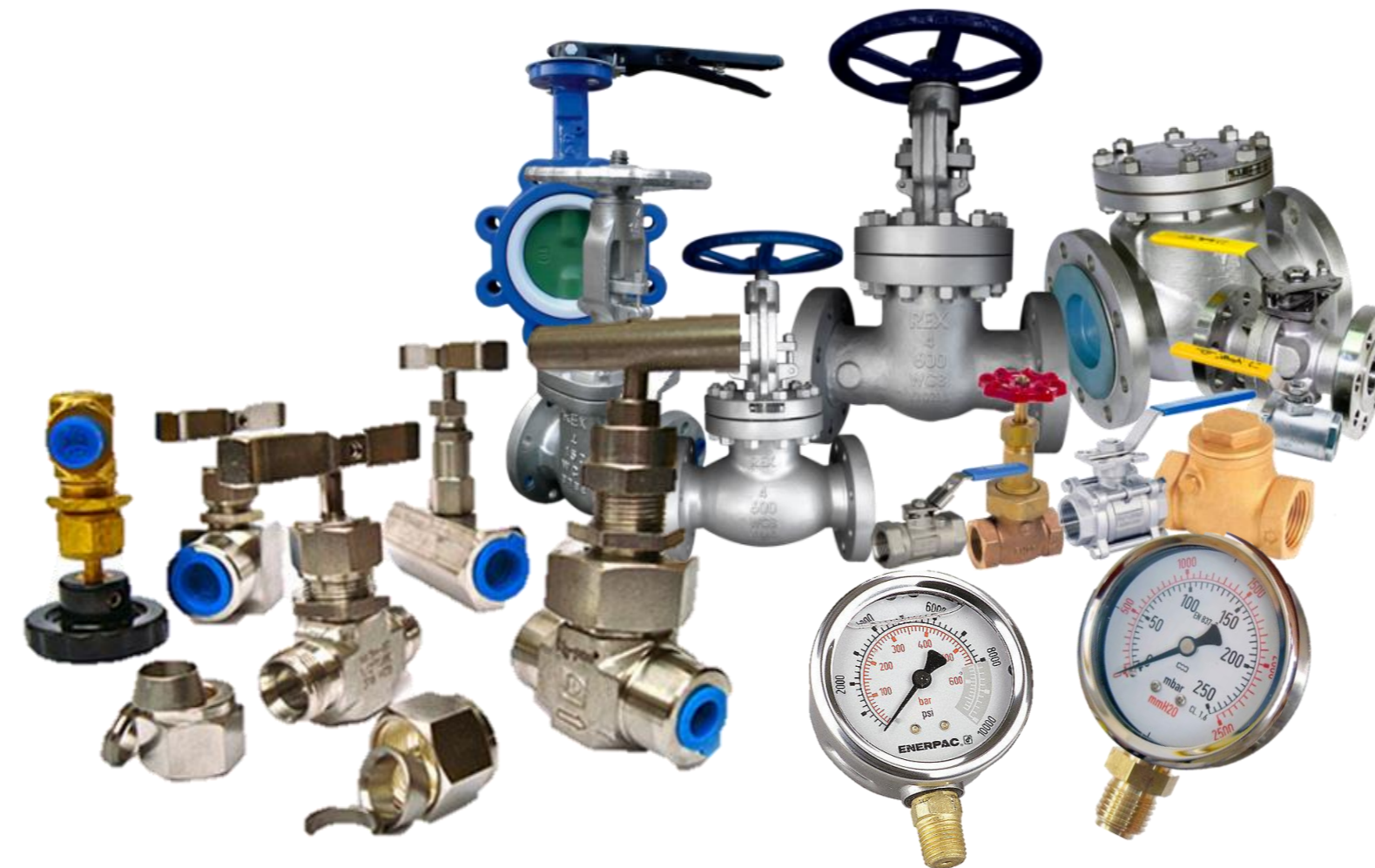
VALVULAS, FILTROS DE BAJO PASO Y MANOMETROS