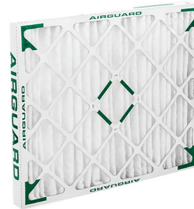
PANELES Y FILTROS PLISADOS